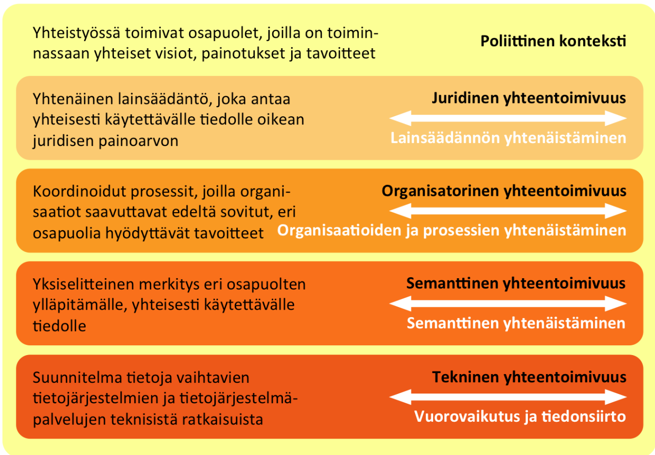
Kuva 1. Julkisen hallinnon yhteentoimivuuden eurooppalainen viitekehys EIF (EC 2010, suom. AL)

Kansa-koulu hankkeessa kehitettävä organisatorinen yhteentoimivuus perustuu sosiaalihuollon palvelutehtävien, sosiaalipalvelujen ja toimintaprosessien kansallisten luokitusten käyttöönottoon. Hankkeella tähdätään organisaatioiden toiminnan ja palvelujen yhdenmukaiseen jäsenyykseen ja asiakastyön kirjaamisen yhdenmukaisiin käytäntöihin.