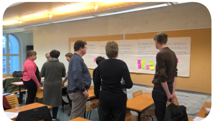
Arvoverkkotyöpaja toi toimijat yhteen Kotkan Höyrypanimolla marraskuussa

Masto-hanketta hallinnoi Kaakkois-Suomen sosiaalialan osaamiskeskus Oy Socom ja kumppaneita ovat Kymenlaakson ammattikorkeakoulu, Saimaan ammattikorkeakoulu, Wirma Lappeenranta sekä alueen kunnat, kuntayhtymät ja monikulttuurisuuskeskukset.