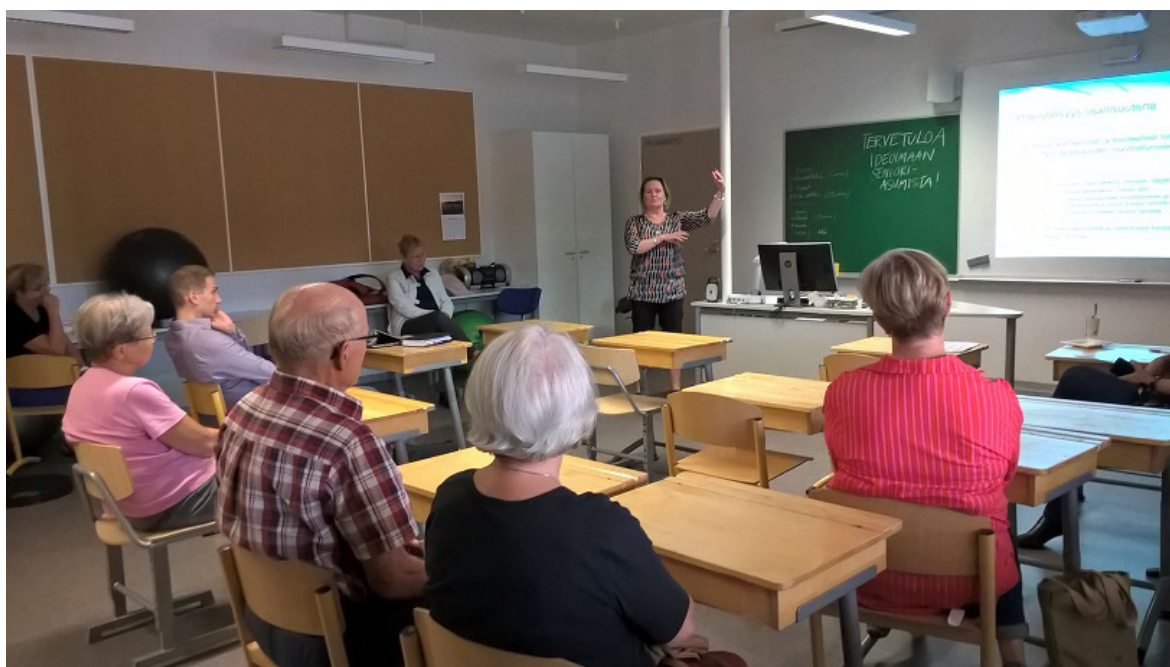
Hankkeen viimeiset työpajat pidettiin 3. pilottikohteessa Luumäellä Kangasvarren koululla elo- ja syyskuussa

Rautjärven aluesuunnitelmat ja Haminan Jamilahden opiston muutossuunnitelmat on annettu osallisille jatkokehittämistä varten ja Luumäki saa omansa lokakuussa lopullisen muutossuunnitelman valmistuttua. Kaikilla pilottikohteilla on ollut tarjota hankkeelle toisistaan poikkeavat mielenkiintoiset kohteet. Hanke on tehnyt alustavat suunnitelmat, tarkemmat suunnitelmat, jatkokehittäminen ja toteutus jää tulevaisuuteen. Mielenkiinnolla jäämme hankkeessa odottamaan toteutuuko pilottipaikkakunnilla yhteisöllinen asuminen tulevaisuudessa.